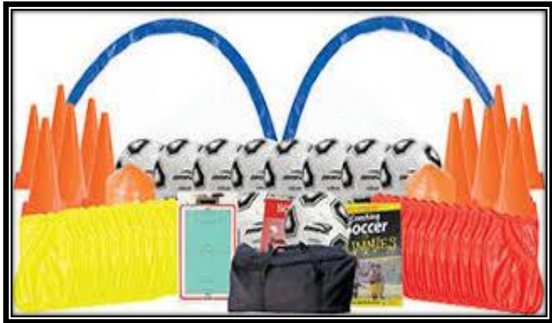
Φωτό 1: Ενδεικτικός Αθλητικός Εξοπλισμός ποδοσφαίρου