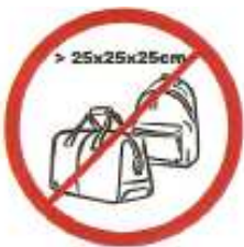
Οποιαδήποτε σακίδια, μεγάλες σακούλες κτλ. μέγιστων διαστάσεων 25εκ. X 25εκ. X 25εκ.