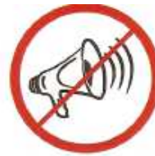
Μηχανικές ή ηλεκτρονικές συσκευές παραγωγή ήχου, όπως τηλεβόες, κόρνες κτλ.