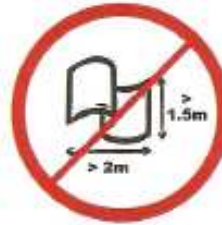
Πανό ή σημαίες μέγιστου μήκους 2μ. X 1,50μ.