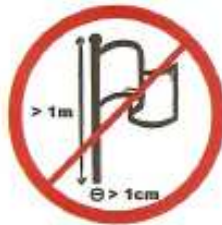
Κοντάρια με σημαίες μέγιστου μήκους 1μ. & 1εκ. διαμέτρου