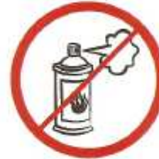
Φιάλες ψεκασμού αερίων