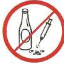
Οινοπνευματώδη ποτά, ναρκωτικά