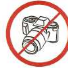
Φωτογραφικές μηχανές, βιντεοκάμερες για επαγγελματικό σκοπό