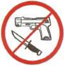
Όπλα κάθε είδους